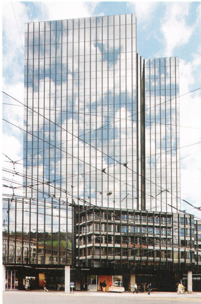
Die neue Fassade spiegelt heute blau

Soweit die Theorie. Das Rathaus der Stadt St. Gallen ist nicht als Denkmal eingestuft, für das ist es noch zu jung. Erbaut hat es die Stadt von 1974 bis 1976. Und doch ist es für St. Galler und St. Gallerinnen ein bedeutendes Gebäude. Hier am Bahnhofplatz wird die Stadt verwaltet, und wer etwas von der Stadt will, landet im ersten Obergeschoss in der Schalterhalle. Was heute selbstverständlich ist, war 1976 neu: «Mit Hilfe der elektronischen Datenverarbeitung konnte die fortschrittliche Publikumsbedienung in St. Gallen erstmals verwirklicht werden», schreiben die Architekten Fred Hochstrasser und Hans Bleiker nach der Eröffnung.