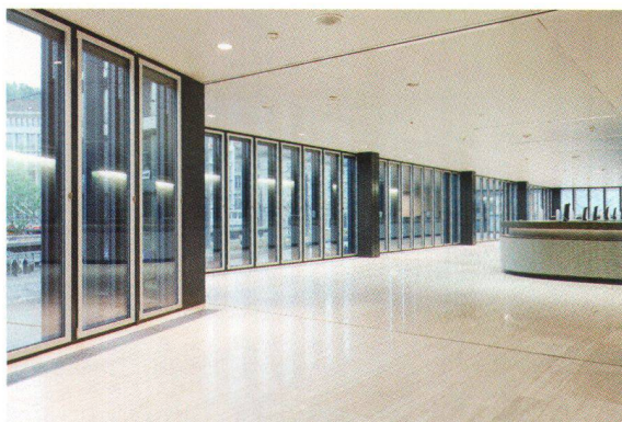
Die helle Schalterhalle mit Blick auf den Bahnhofplatz

Luminosité du hall des guichets donnant sur la place de la Gare