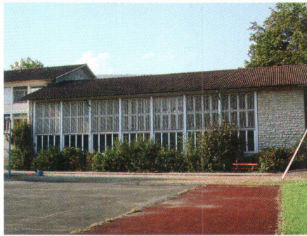
Collège de Delémont, 1953, de Hans et Gret Reinhard, Berne