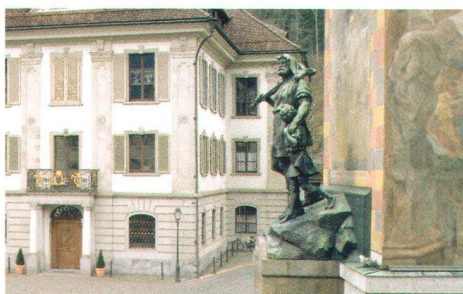
Statue Wilhelm Tell auf dem Rathausplatz Altdorf

→ Die Schweiz existiert als Bundesstaat in ihrer gegenwärtigen Form seit Annahme der Bundesverfassung 1848. Vorläufer der modernen Schweiz waren die seit Ende des 13. Jh. als Staatenbund organisierte Eidgenossenschaft, die zwischen 1798 und 1803 bestehende Helvetische Republik sowie die 1815 neu organisierte «Schweizerische Eidgenossenschaft». Will man «Best Owner» eines Baudenkmals sein, gehört die Auseinandersetzung mit der Geschichte zur Pflicht. Voraussetzung für einen sorgfältigen Umgang mit alter Bausubstanz ist ein gewisses Verständnis für die Vergangenheit.