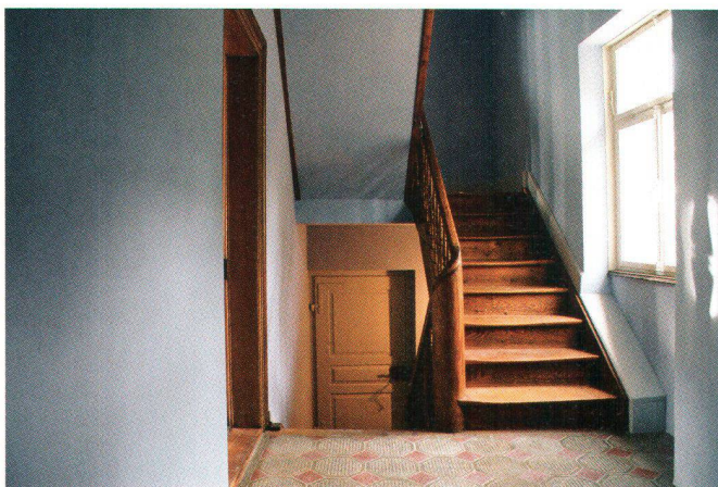
Der Verputz im Treppenhaus ist neu und blau

Dans l'escalier, le nouveau crépi est bleu