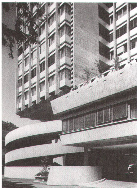
Geschäftshaus «Zur Palme», Zürich 1959–64, Haefeli Moser Steiger mit André M. Studer