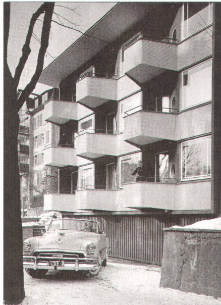
Apartmenthaus, Forchstrasse 148, Zürich 1953–55, Werner Stücheli, Zürich

tektur, stach den von der Rolltreppe kommenden Messebesuchern sofort ins Auge. Filmmusik aus vergangener Zeit lockte sie an. Nicht wenige nahmen auf den Kinossesseln Platz und liessen sich mit Filmdokumenten aus den 50ern um Jahre zurückversetzen. Auf reges Interesse stiess zudem die Verlosung eines der vier grossformatigen Schwarz-Weiss-Posters mit Architekturperlen der Nachkriegszeit (siehe oben).