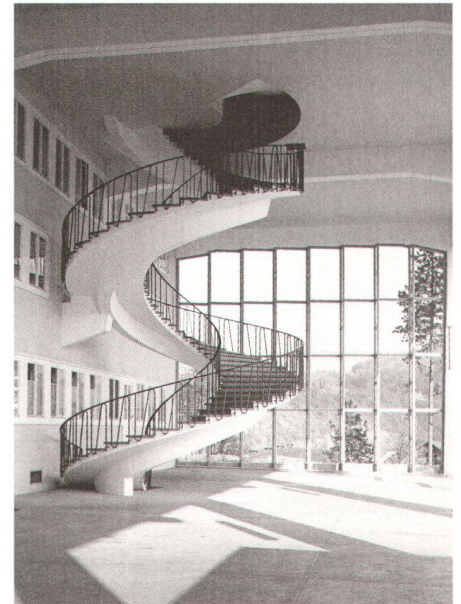
Freitragende Spiraltreppe, ehemaliges Gemeinschaftshaus der BBC, Baden 1952–54, Armin Meili, Zürich/Luzern

An der Kinobar entstanden zahlreiche interessante Gespräche. So ging es um die Frage nach einer denkmalpflegerisch und gleichzeitig energetisch angemessene Sanierung der schlecht isolierten 50er-Jahre-Bauten. Sehr oft aber staunten die Besucherinnen und Besucher einfach nur ob der bis anhin unbeachteten und erstaunlich eleganten, ansprechenden Architektur der 50er-Jahre. Das Ziel, einer breiteren Öffentlichkeit unser Anliegen näherzubringen, konnte zweifellos erreicht werden.