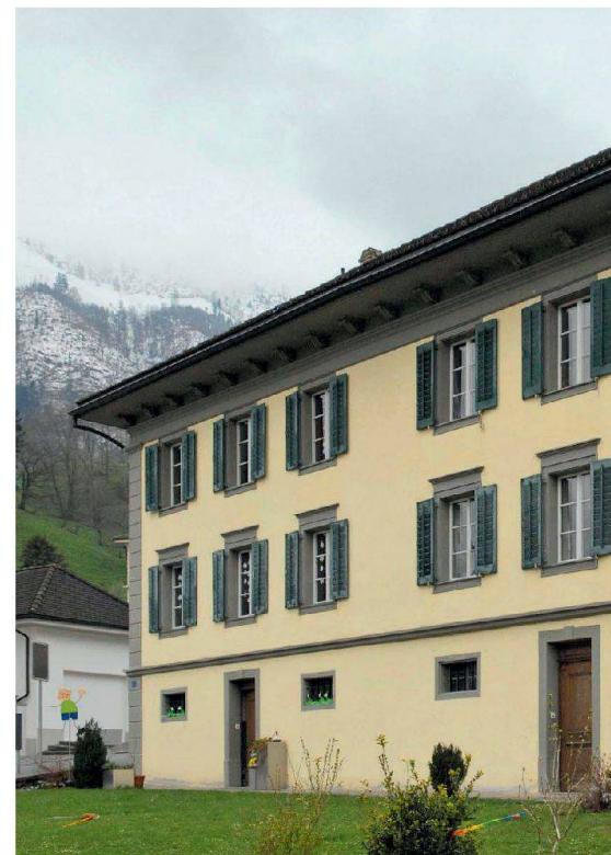
Stans, Kaplanenhaus, Knirigasse 2, Baujahr 1846, Ansicht von Nord-Osten

Die vier Gebäude der katholischen Kirchgemeinde Stans stammen aus den Jahren 1691 (Sigristenhaus), 1720 (Organistenhaus), 1859 (Pfarrhaus) sowie 1846 (Kaplanenhaus) und dienen auch heute noch der Wohn- und Büronutzung. Die beiden älteren Häuser weisen typischerweise einen Sockel aus verputztem Bruchsteinmauerwerk, in Blockbauweise errichtete, verschindelte Oberbauten und Krüppelwalmdächer auf. Die Aussenwände des Pfarrhauses hingegen bestehen aus einer verputzten Riegelkonstruktion, diejenigen des