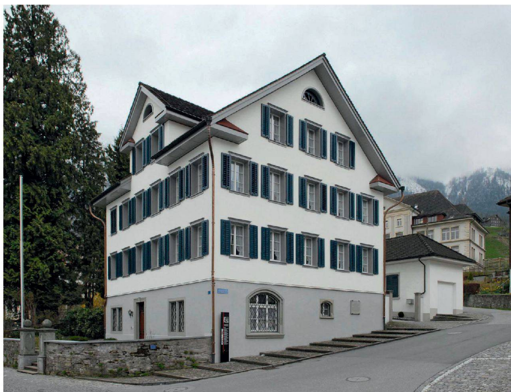
Stans, cure, Knirigasse 1, construction 1859–1860, architecte: Johann Meyer, Hergiswil. Vue depuis le nord-est

eine Aussendämmung naheliegend. Nachdem die Schindeln entfernt und die vorstehenden alten Nägel eingeschlagen waren, wurde eine diffusionsoffene Folie als Luftdichtung/Dampfbremse, eine Wärmedämmschicht aus 2350 mm dicken Mineralfaserplatten und eine Holzschalung appliziert. Aufgrund des guten Austrocknungsverhaltens des Schindelschirms konnten die Schindeln direkt auf die nicht hinterlüftete Holzschalung genagelt werden.