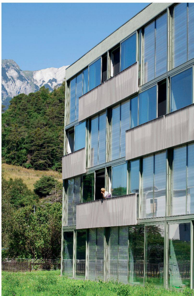
Logements pour personnes âgées à Domat/Ems (bureau d'architecture Dietrich Schwarz). Les grandes fenêtres côté sud constituent le cœur de l'approvisionnement en chaleur. Des capteurs solaires d'une surface de 22,5 m 2 et deux pompes à chaleur air/eau fournissent le solde de calories. Ce bâtiment innovatif a reçu le Prix solaire 2006

Cependant, alors que la population de la Suisse reste presque constante, sa surface construite ne cesse de grandir. Si ses habitants sont plus nombreux à posséder des logements de plus en plus grands (la surface moyenne par habitant a augmenté de 39 m 2 en 1990 à 44 m 2 en 2000), c'est surtout la surface construite non résidentielle (industrie, bureaux, commerces) qui est en nette croissance. Ce parc immobilier grandissant, vieillissant aussi, et souvent chauffé au mazout, est le principal consommateur des importations suisses en ressources fossiles (environ deux tiers). De plus, la demande croissante en électricité nécessaire pour l'utilisation d'un nombre grandissant d'appareils électriques (certes plus efficaces mais en plus