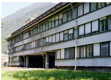
Verwaltungsgebäude Eternit AG in Niederurnen