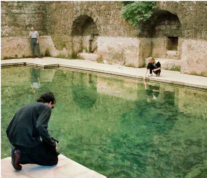
Les thermes d'Allianio en Turquie.