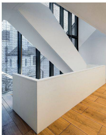
Das Ensemble Sankt Urbanhof, Mittelhaus und Stadttheater mit Bühnenturm (links). Der restaurierte und rekonstruierte Äbtesaal (Mitte). Ein Siebdruck auf den Gläsern soll das neue Treppenhaus vor Sonne schützen (rechts).

L'ensemble est devenu un prestigieux havre de culture. Le «Sankt Urbanhof» est flanqué d'une cage d'escalier en acier et verre et comporte côté jardin deux annexes en béton et verre et un grand bâtiment en bois. L'intérieur, en particulier un plafond à caissons de 1606, a été restauré avec soin. Le sous-sol abrite une exposition archéologique permanente. L'ensemble fait partie des réalisations distinguées par le prix de la conservation des monuments historiques 2010.