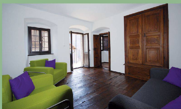
Casa Döbeli — Russo (TI)

Unter www.magnificasa.ch finden Sie weitere aussergewöhnliche Häuser.