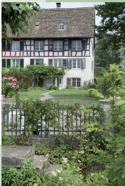
Haus Blumenhalde — Uerikon (ZH)