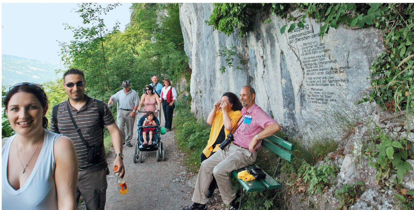
Der über 110-jährige Felsenweg am Bürgenstock gehört mit zu den «schönsten Spaziergängen der Schweiz».

Das 76-seitige Büchlein (deutsch/französisch) mit vielen farbigen Abbildungen ist unter www.heimatschutz.ch/shop zu bestellen und kostet CHF 16.– (für Heimatschutz-Mitglieder CHF 8.–).