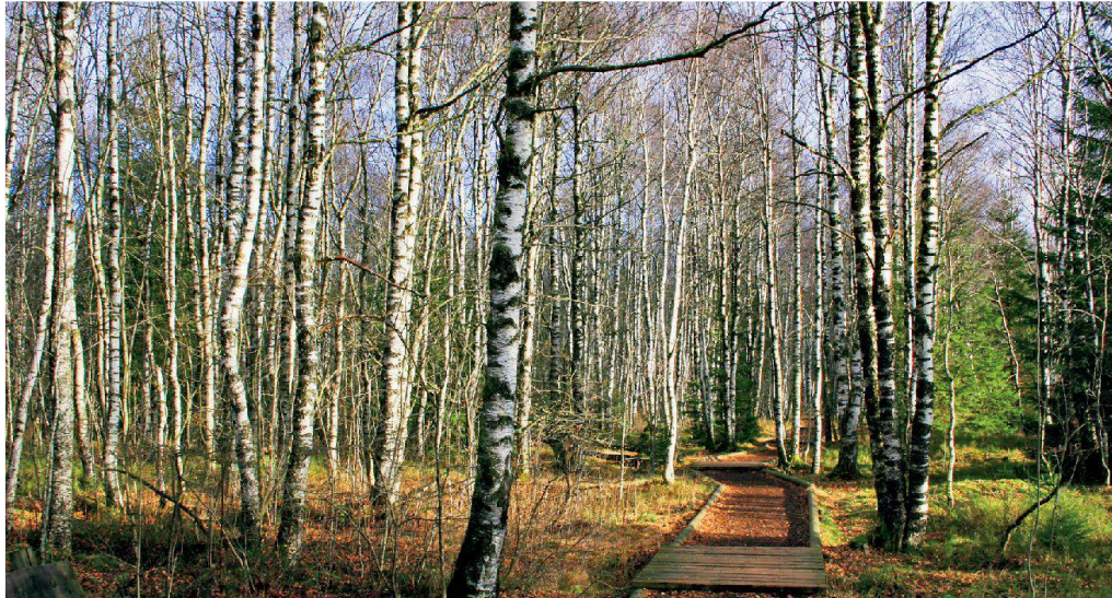
Hauts-marais près des Ponts-de-Martel, impression d'une excursion décrite dans «Les plus belles promenades de Suisse».