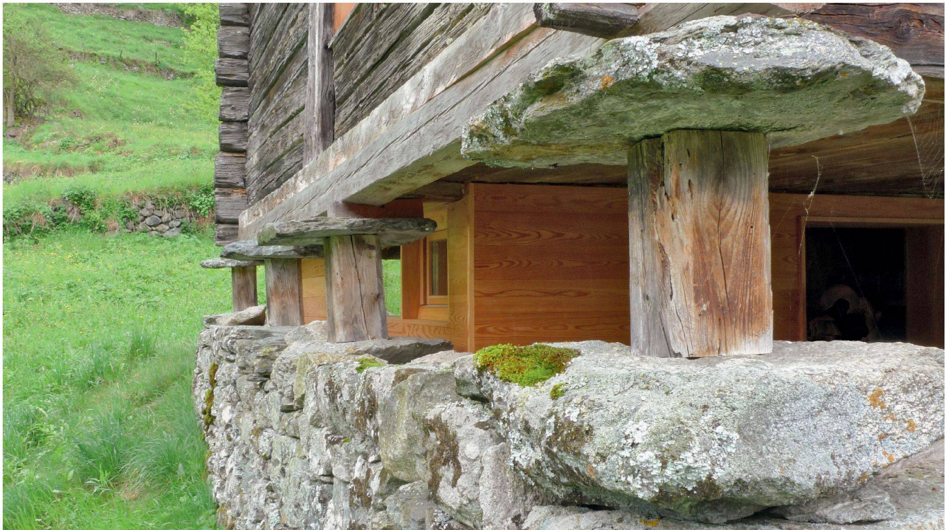
Fachgerecht erhaltenes Gebäude mit neuer Nutzung (Stadel bei Sarreyer/Bagnes).