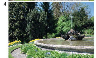
1: Weg am Alpengarten vorbei zur Villa