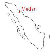
L'île de Sumatra, avec la ville de Medan