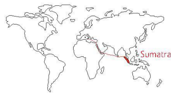
Voyage de la Sicile à Sumatra via le canal de Suez; (illustration Ps)