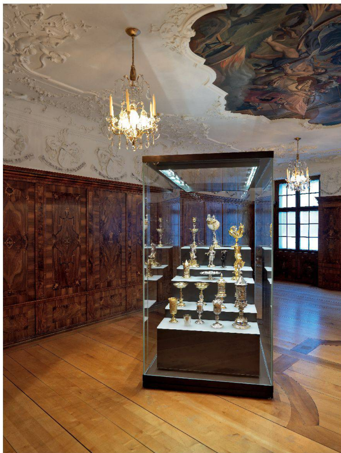
Museum zu Allerheiligen, Schaffhausen: Festsaal aus dem Zunfthaus der Gerber von 1734 mit der neuen Präsentation des Schaffhauser Zunftsilbers.

Historismus und auch angesichts der allmählichen Verbreitung des Ausstellungswesens der Darstellung, ja sogar der Zelebrierung des Wohnens eine zunehmende Bedeutung beimass. Um die Mitte des 19. Jahrhunderts entstanden dann in Europa die ersten Kunstgewerbemuseen und die historischen Museen. Diese räumten der Ausstellung von Alltagsgegenständen und der Darstellung des täglichen Lebens einen hohen Stellenwert ein, dies ganz im Gegensatz zu den traditionellen Kunstmuseen mit ihrem Geniekult. Es wurde eine wichtige Museumsaufgabe, dem Besucher zu zeigen, wie man in früheren Epochen gelebt hatte, und die Präsentation von Wohnräumen wurde ein beliebtes museographisches Konzept. Freilich drängen sich aus heutiger Sicht wichtige Einschränkungen bezüglich der Authentizität solcher «Period Rooms» auf: In Ermangelung von Objekten aus dem Besitz der ärmeren Bevölkerungsschichten konnten die Museen meist nur die Lebensformen der «upper class» präsentieren; und zwecks Darstellung möglichst eingängiger Wohn- und Stilkonzepte griffen die Museumsverantwortlichen mitunter in die Trickkiste der Szenographen und arrangierten mithilfe von Kopien und Stilvermischungen auch fragwürdigere Raumentsembles, welche mit effektiv historischen Befunden nur noch wenig zu tun hatten. Entsprechend genossen solche «Historische Zimmer» in den Museen nicht immer den besten Ruf als wahrheitsgetreues Ausstellungsgut und als schlüssiges Vermittlungskonzept.