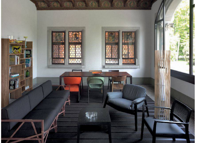
Stube mit zeitgenössischen Möbeln von Schweizer Herstellern und Designern.

Das Landesmuseum Zürich zeigt seit dem 25. Juni 2010 im Westflügel eine permanente Ausstellung: «Möbel & Räume Schweiz». Sie präsentiert Innenräume und Möbel der Sammlung des Schweizerischen Nationalmuseums. Ausgangspunkt bilden die eingebauten «Historischen Zimmer», die das Landesmuseum einst weit über die Landesgrenzen hinaus berühmt machten. In den Räumen vor den Zimmern werden Schweizer Möbel des 20. Jahrhunderts inszeniert.