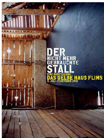
«Der nicht mehr gebrauchte Stall» – eine Ausstellung unter dem Patronat des Bündner Heimatschutzes in Flims.