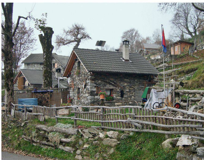
Umgebautes Rustico im Tessin.