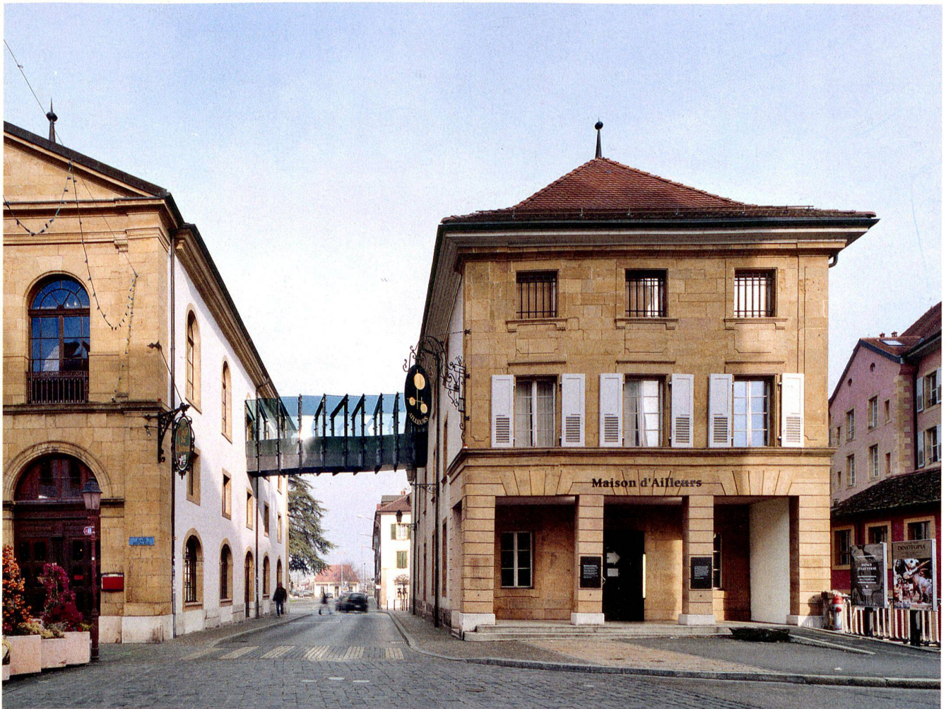
Die Maison d'Ailleurs in Yverdon-les-Bains. Die Stadt Yverdon erhielt 2009 den Wakkerpreis des Schweizer Heimatschutzes.