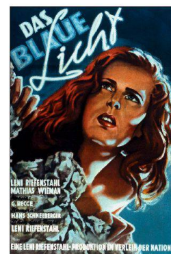
Foroglio est célèbre dans toute l'Europe pour sa magnifique cascade de 100 m de hauteur dévalant du Val Calnegia. Cette chute d'eau imposante servit de décor au film «La lumière bleue» (1931) de la réalisatrice allemande Leni Riefenstahl.

ren – von 1965 bis 1970 – wurden durch einen kaum vorstellbaren, einschneidenden Vorgang im Valle Bavona drei grosse Staudämme, drei in den Fels gehauene Kraftwerke und kilometerlange, unsichtbare Stollen durch die Berge erschaffen. Welche Opfer dies für die Landschaft und für die Bevölkerung bedeutete, ist an den Wasserläufen zu beobachten, die sich über lange Strecken nur noch als Rinnsale zeigen, die sich in den breiten, ausgetrockneten Flussbetten zwischen Felsblöcken verlieren. Auf das abrupte Ende einer längst vergangenen