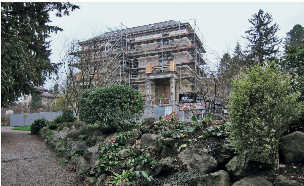
Die Renovationsarbeiten an der Villa Patumbah sind in vollem Gange.