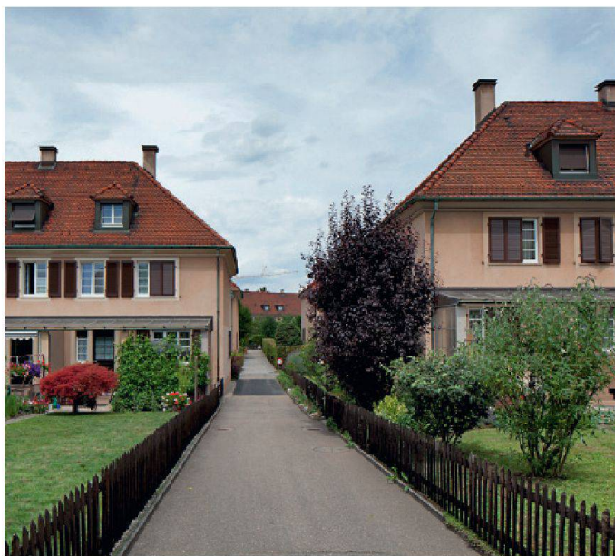
Un exemple de réalisation architecturale d'avant-garde: la cité-jardin Freidorf de Muttenz.

Sur la maquette, le potentiel de densification semble se situer dans les quartiers de maisons individuelles. Dans ces quartiers, la commune mène une politique active de densification douce et conseille les propriétaires. Tous les deux ans, elle délivre un prix d'architecture qui récompense ces densifications à petite échelle. Cette politique surprend Walter Ulmann car à Uster, il serait difficile de densifier de tels quartiers. En effet, la maison individuelle reste le rêve d'une majorité de personnes. Claude Barbey explique que Granges n'est pas confrontée à un problème de densification, mais au vieillissement des propriétaires de maisons individuelles. Les jeunes n'en veulent pas, et les constructions qui sortent de terre seront