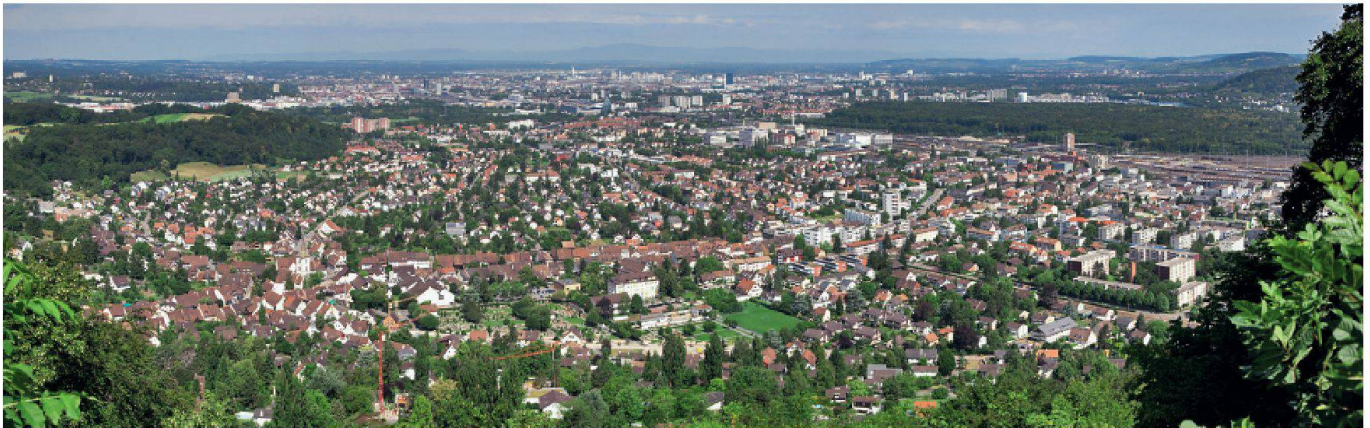
MuttENZ, Wakkerpreis 1983.