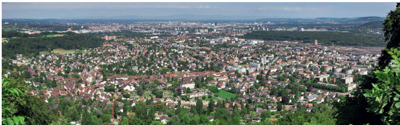
MuttENZ, Wakkerpreis 1983.