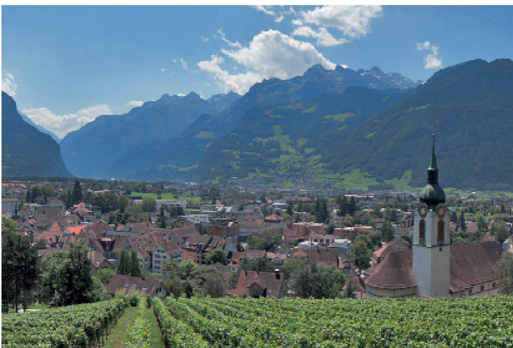
Altdorf, Wakkerpreis 2007.

Die einem eher konservativen Schweizbild verpflichtete Stiftung für Orts- & Landbildpflege, Archicultura, teilt schon heute die Schweiz in Gebiete mit sehr guten und sehr schlechten Ortsbildqualitäten ein. Ihr Fazit: In den Ballungsräumen des Mittellands sind wenig gute Ortsbildqualitäten auszumachen, in den ländlichen Gebieten umso mehr. Je peripherer die Lage also, umso besser ist das Ortsbild?