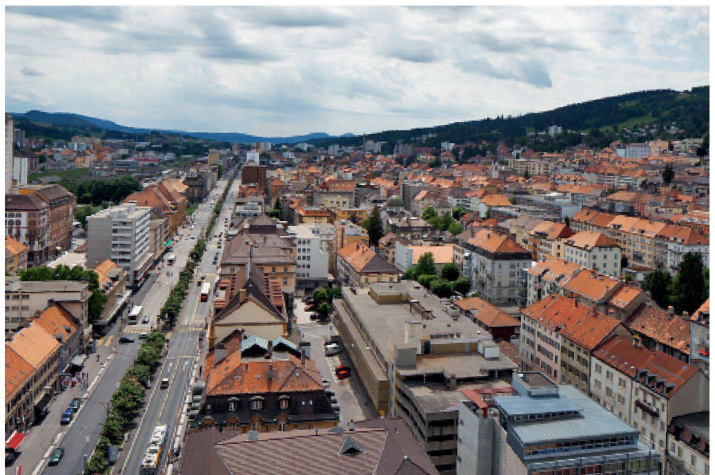
La Chaux-de-Fonds, Prix Wakker 1994.