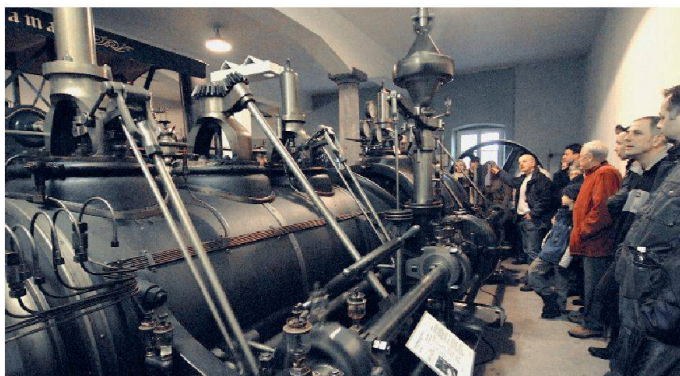
Die ersten Dampfmaschinen aus dem Vaporama Thun sind demnächst im Dampfzentrum Winterthur zu sehen.

Le public pourra bientôt voir les premières machines à vapeur du Vaporama de Thoun au Dampfzentrum de Winterthur.