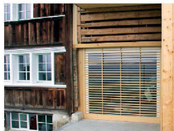
Gais AR, Luser. Im Raum zwischen Wohn- und Stallteil ist eine grosse Öffnung in der Aussenwand möglich.