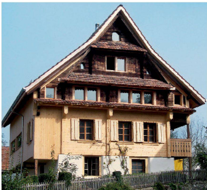
Maison Sagenmatt, Gisikon (LU), rénovation 2007: une île entourée de constructions nouvelles, d'artères de trafic et d'une ligne ferroviaire.

La situation de l'objet – éloigné ou proche d'un village urbanisé – joue un rôle important. La limitation effective ou présumée des possibilités de transformer un bâtiment ancien se heurte à un sentiment d'incompréhension lorsque l'objet est situé à l'écart et dans un endroit marqué par l'exode rural. Ces restric-