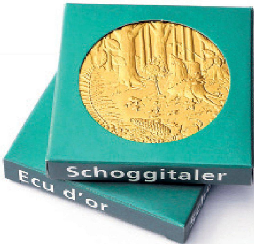
Die Schoggitaler-Geschenkpäckchen – rundum eine gute Sache!