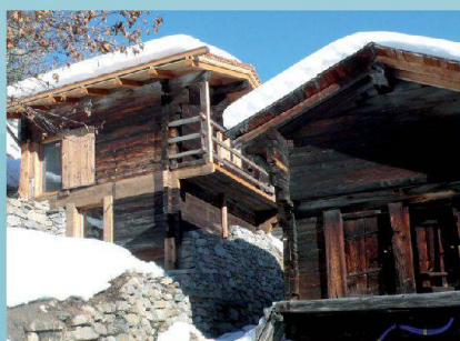
Stallscheune — Niederwald (VS)