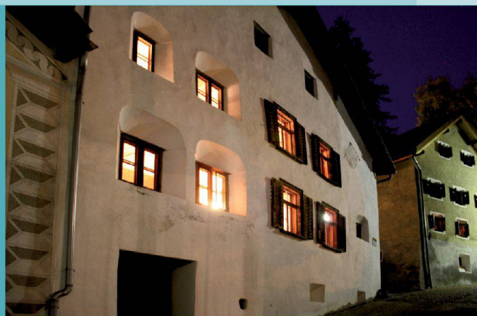
Engadinerhaus — Scuol (GR)

Découvrez d'autres maisons hors du commun sur www.magnificasa.ch .