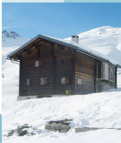
Nüw Hus — Safiental (GR)

Unter www.magnificasa.ch finden Sie weitere aussergewöhnliche Häuser.