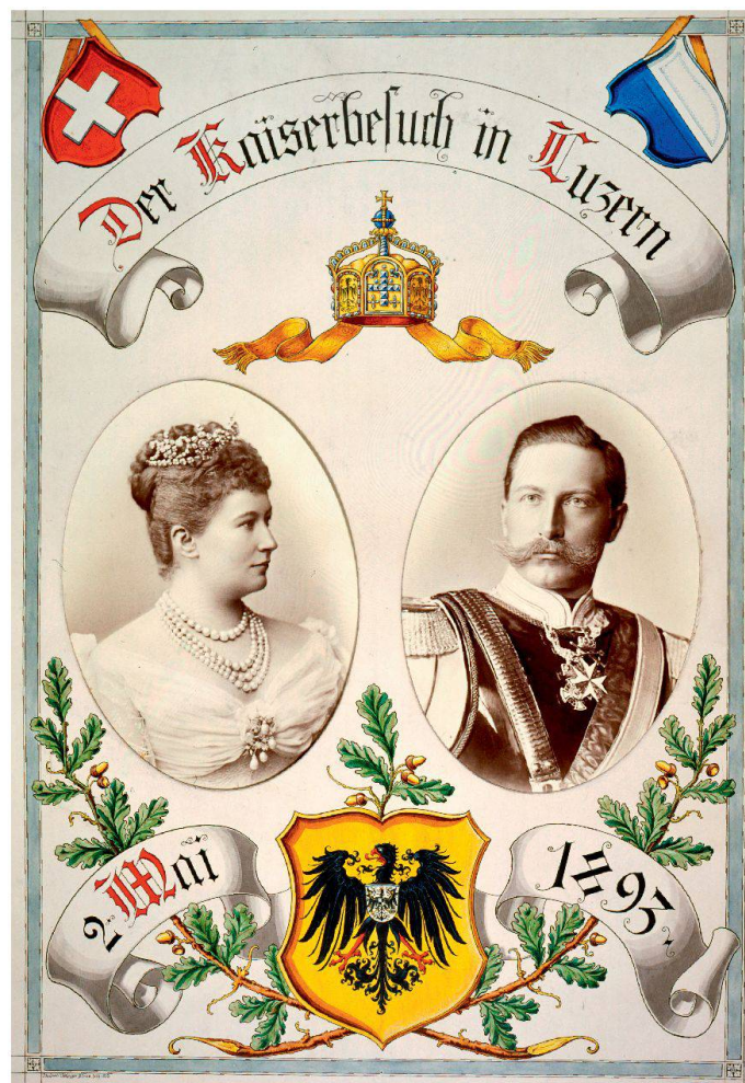
Page de couverture de l'album souvenir de la visite impériale à Lucerne: l'empereur Guillaume II et l'impératrice Augusta-Victoria d'Allemagne.

La visite impériale qui ne dura que deux heures et quart fut un grand événement politique et