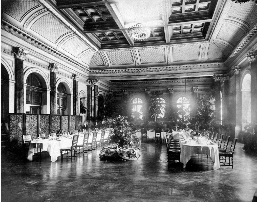
La Zeugheersaal, salle spécialement aménagée dans l'Hôtel Schweizerhof (1865) pour le banquet officiel du Conseil fédéral et du couple impérial.