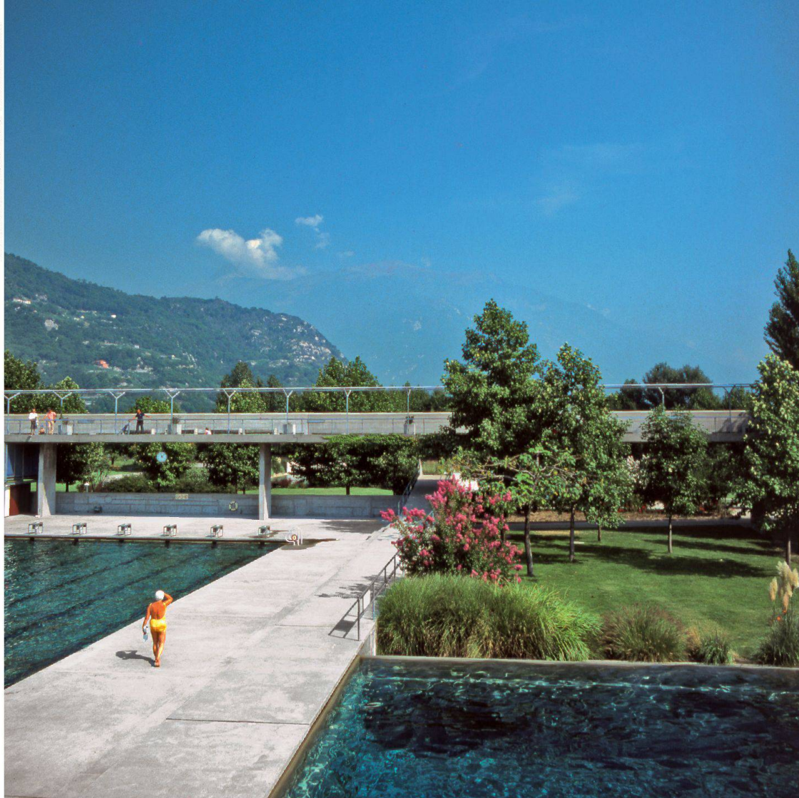
Die Schwimmbecken in den 1970er-Jahren