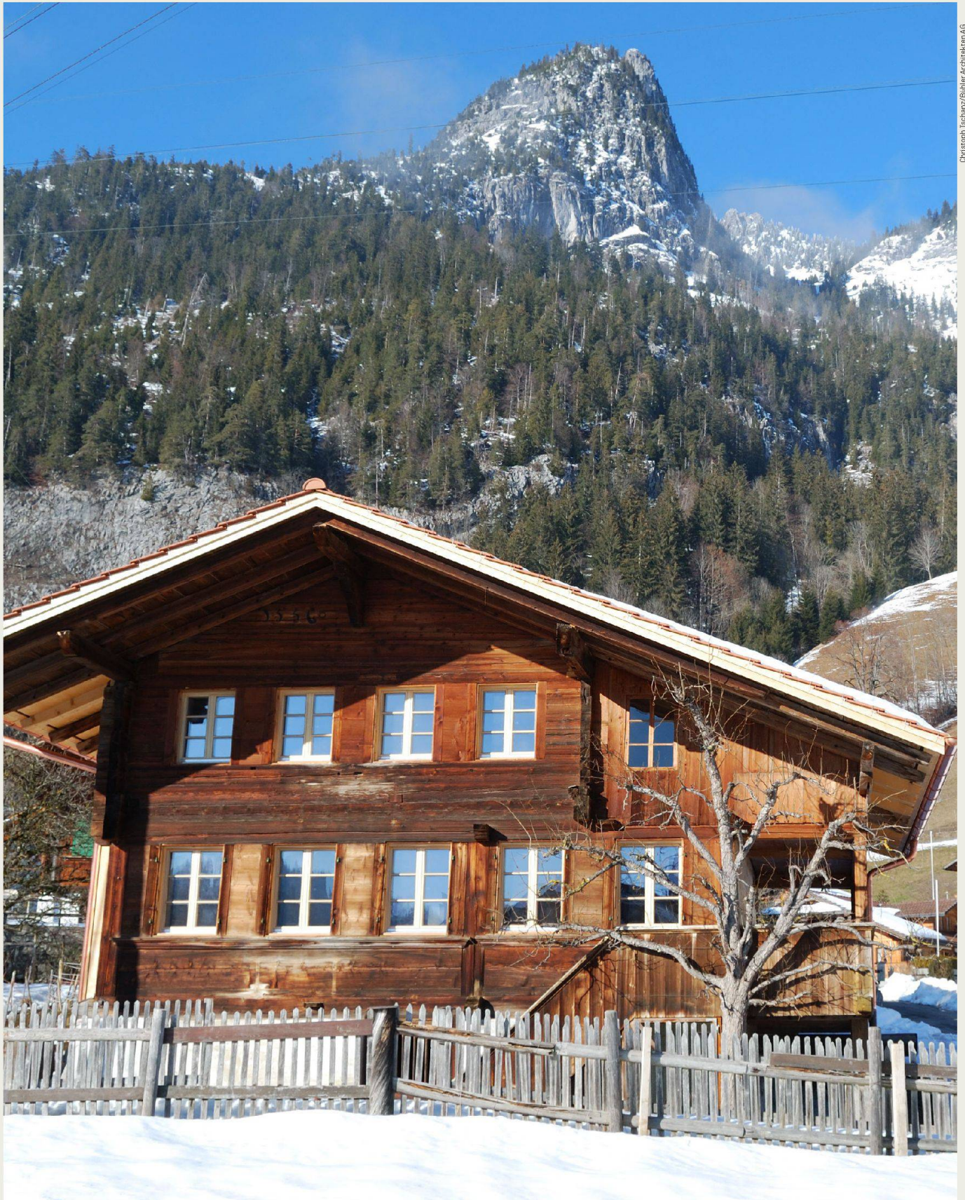
Ein Höhepunkt für die Stiftung Ferien im Baudenkmal des Schweizer Heimatschutzes war die Eröffnung des Hauses auf der Kreuzgasse in Boltigen. Das regionaltypische Kleinbauernhaus aus dem 16. Jahrhundert wurde in Zusammenarbeit mit der Denkmalpflege umfassend saniert