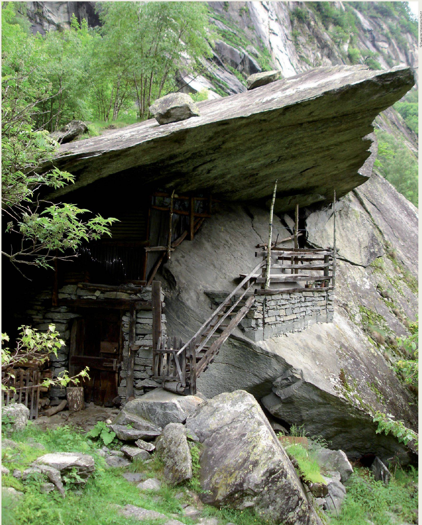
Seit 1994 unterstützt der Schweizer Heimatschutz aus seinem Legat Rosbaud die Fondazione Valle Bavona und die Umsetzung verschiedener Projekte im Tessiner Valle Bavona grosszügig.