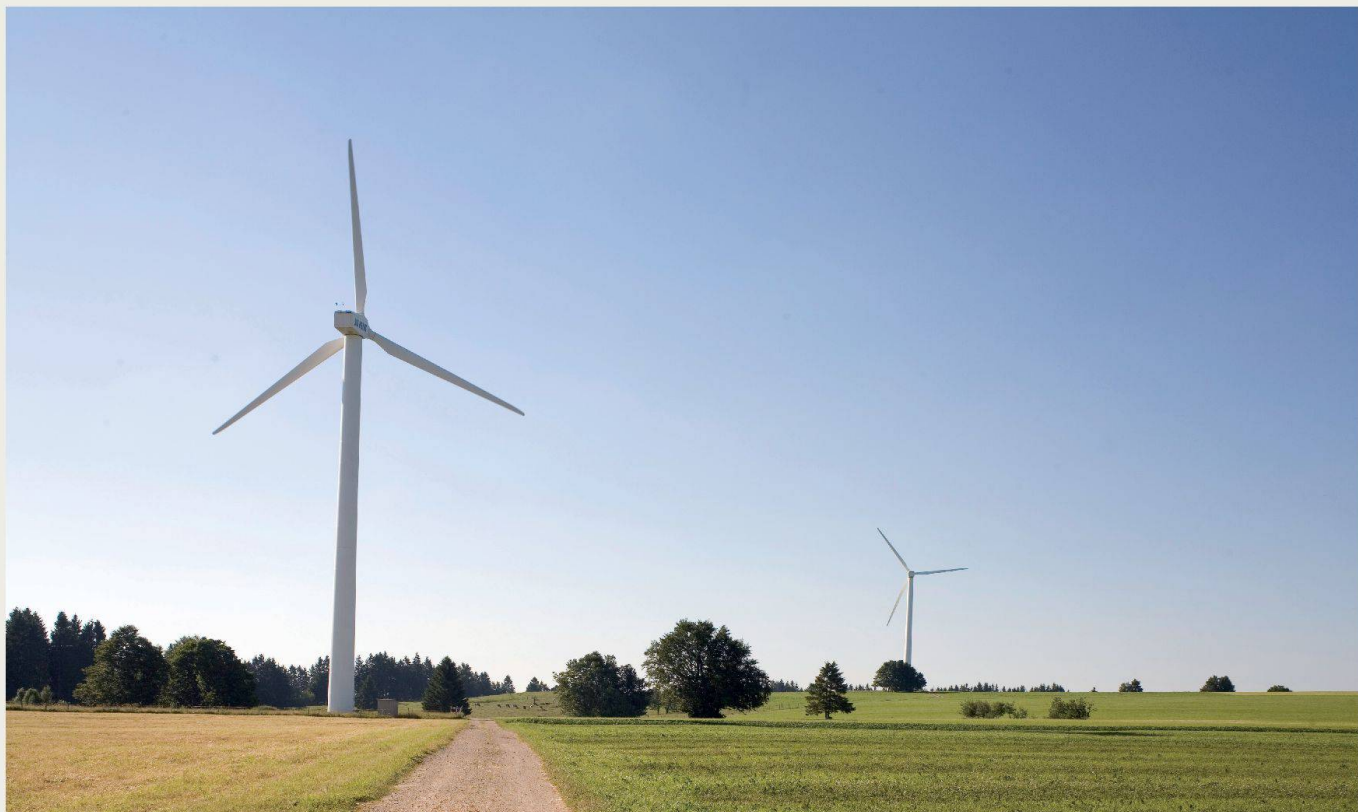
Dans sa prise de position, Patrimoine suisse explique son positionnement sur les installations éoliennes et récapitule les critères à observer dès le stade de la planification de telles installations afin d'optimiser leur intégration dans l'environnement.