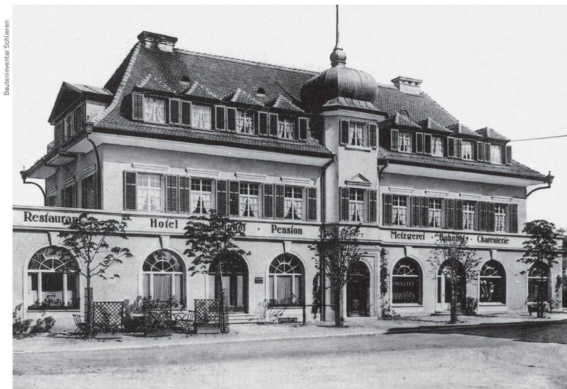
Auch sogenannte Verlustobjekte wie das 1968 abgerissene Gebäude mit Restaurant, Hotel, Pension und Metzgerei an der Bahnhofstrasse sind im neuen Bauteninventar von Schlieren erfasst.

→ Das Bauteninventar der Stadt Schlieren ist einsehbar unter www.schlieren.ch/de/tourismus/bauteninventar