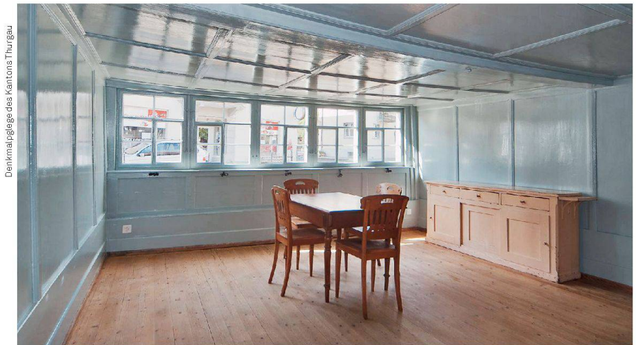
Denkmalpflege des Kantons Thurgau

Der Verband der Schweizer Holzwirtschaft und das Bundesamt für Umwelt sind sehr angetan vom sorgsamem Umgang mit der historischen Bausubstanz. Sie haben die Fischerhäuser als einzige der zwölf eingereichten Objekte im Kanton mit einem Anerkennungspreis ausgezeichnet, dem «Prix