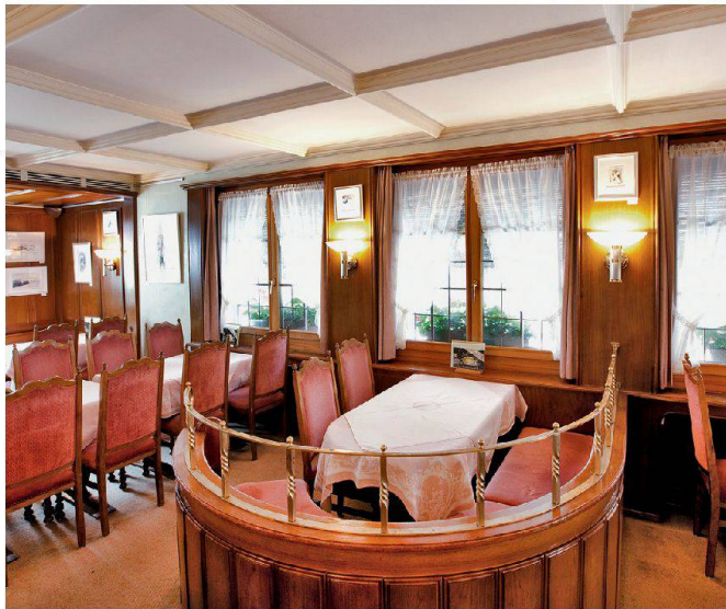
Café Laimbacher à Appenzell Café Laimbacher in Appenzell

et distinguée, qui connut son apogée dans les années 1940 à 1960. Qui aurait oublié l'ambiance feutrée de ces salons de thé typiques aux murs recouverts de tapisseries à fleurs? Les établissements, avec du mobilier rembourré et des plantes vertes, qui proposaient des toasts Hawaï ou des canapés aux asperges ne sont plus à la mode. Souvent, le départ à la retraite de leur tenancier et leur disparition, faute de trouver un successeur, ne sont qu'une question de temps. Les établissements comme le Tea room Métropole de Sierre dont l'aménagement intérieur des années 1960 a été préservé se font de plus en plus rares.