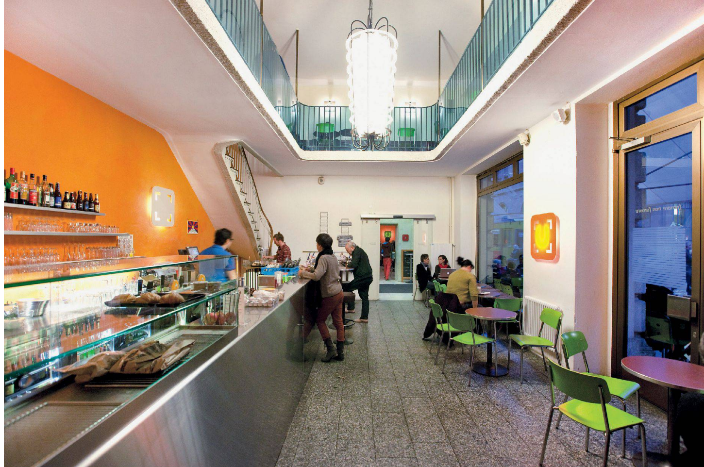
Von der Bank zum Café: «Unternehmen Mitte» in Basel Transformation d'une banque en café: «Unternehmen Mitte» à Bâle

wandeln sich jeweils beinahe unbemerkt vom Café zur Bar, wenn am späteren Nachmittag die Kaffeetassen auf den Tischen verschwinden und allmählich Bier-, Wein- und Cocktailgläser deren Platz einnehmen.