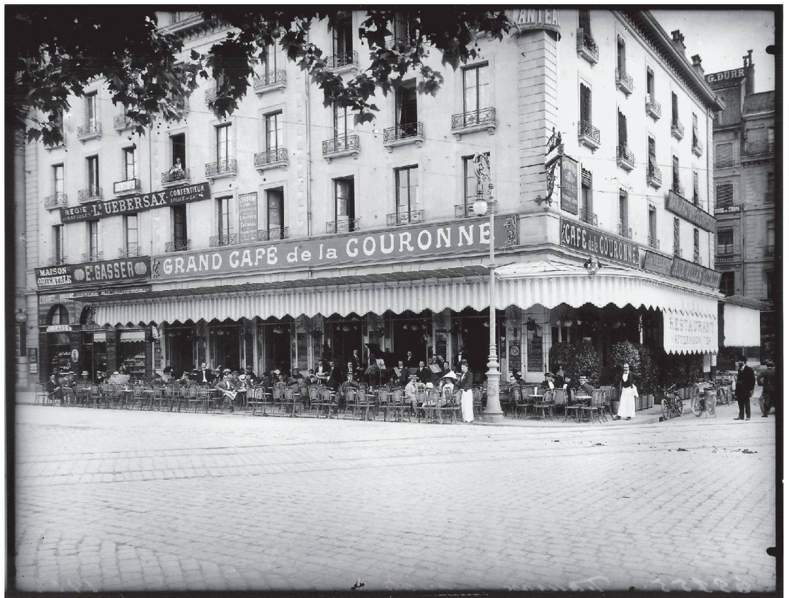
Gasmann, archives Armand Brulhart

Disparu: le Grand Café de la Couronne à Genève en 1913