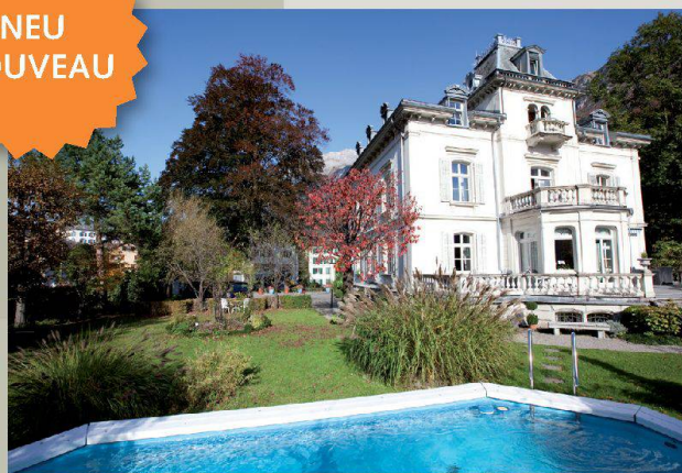
Weisse Villa — Mitlödi (GL)

Unter www.magnificasa.ch finden Sie weitere aussergewöhnliche Häuser.