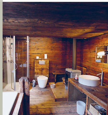
Gon Hüs — Niederwald (VS)

Passez des jours reposants au cœur du patrimoine!