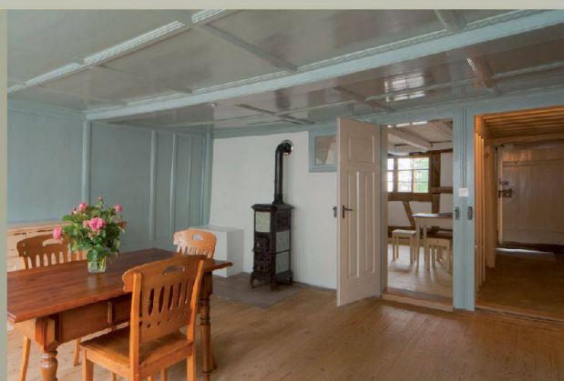
Fischerhäuser — Romanshorn (TG)

Découvrez d'autres maisons hors du commun sur www.magnificasa.ch .