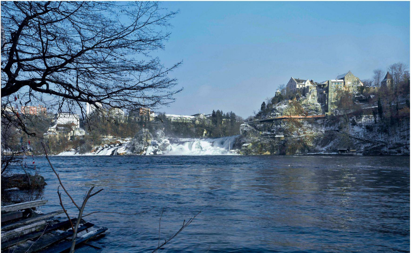
Hochbauamt Kanton Zürich, M. Rötliberger