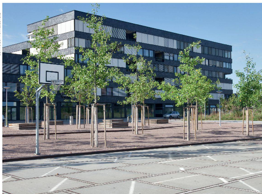
Der Erlenmattpark in Basel vom Landschaftsarchitekturbüro Raymond Vogel Landschaften AG Le parc Erlenmatt à Bâle du bureau d'architecture paysagiste Raymond Vogel Landschaften AG

Patrick Schoeck-Ritschard, Schweizer Heimatschutz