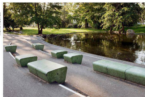
Der Stadtpark Uster wurde 2008 von Schweingruber Zulauf Landschaftsarchitekten umgestaltet.