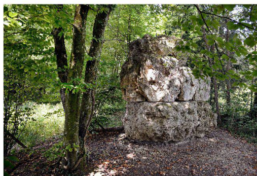
Le Zellweger-Park d'Uster et le «Cube» de Sol LeWitt, le «Moosfelsen» de Fischli/Weiss et la «Drift Structure» de Tadashi Kawamata (à droite, de haut en bas)