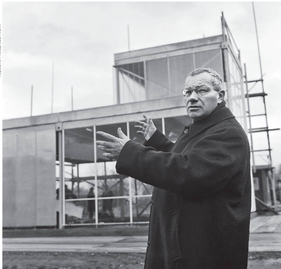
L'artiste Max Bill, architecte de la section «Eduquer et créer» de l'Expo 64, sur son chantier

Der Künstler Max Bill, Architekt des Sektors «Bilden und Gestalten» der Expo 64, auf der Baustelle in Vidy