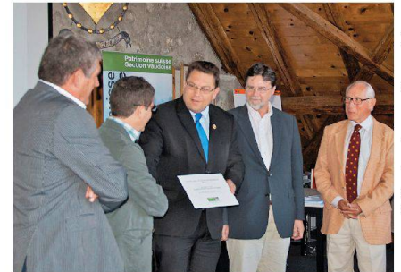
Patrimoine suisse, section vaudoise