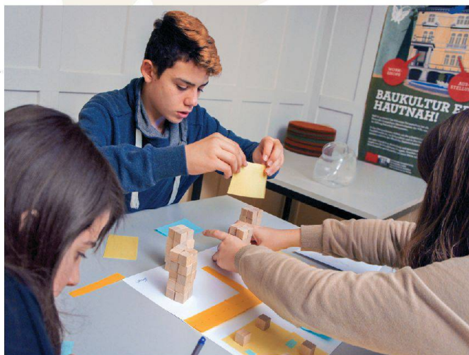
Du papier et des cubes de bois sont fournis à des groupes d'élèves qui sont chargés de planifier la construction d'un quartier.

In Gruppen gestalten die Schülerinnen und Schüler mit Papier und Holzklötzchen ein Quartier.