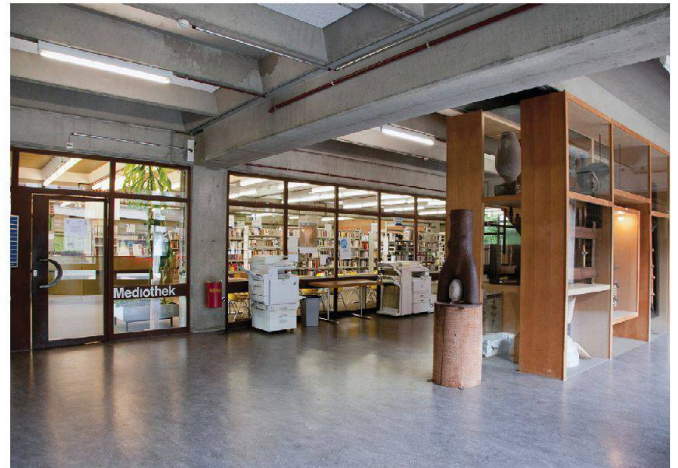
Vertreter/innen des Hochbauamts und der Denkmalpflege führten durch die Kantonsschule Hardwald.