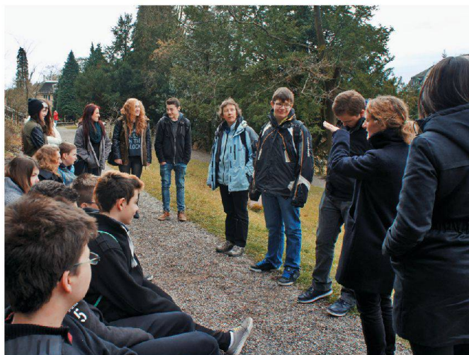
Une promenade dans le parc Patumbah permet d'observer les modifications de notre environnement intervenues au cours de ces dernières décennies.

In Gruppen gestalten die Schülerinnen und Schüler mit Papier und Holzklötzchen ein Quartier.