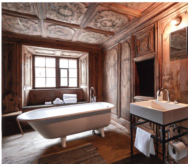
▲ TÜRILIHUS, VALENDAS (GR)