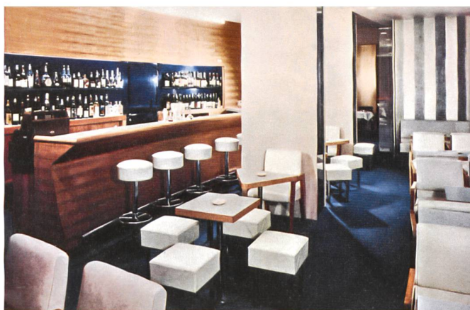
L'aménagement d'origine du bar et du grand hall (dans Félix Perret: Hôtel du Rhône Genève, plaquette – souvenir – II e anniversaire, Genève 1952)