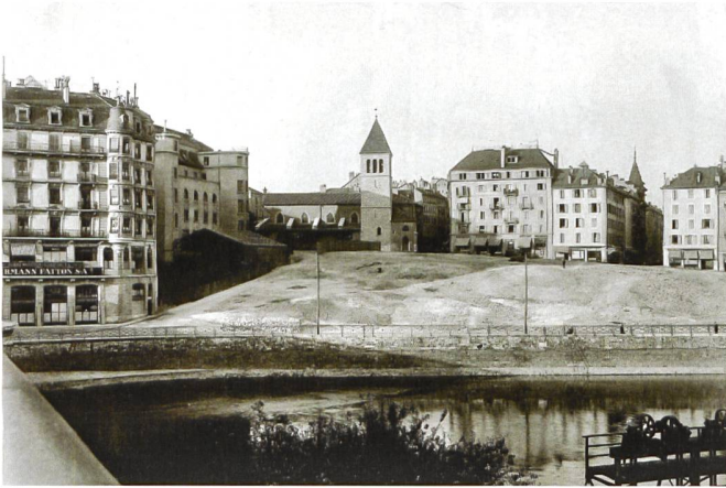
April 1934 – avril 1934

Julien, BGE, Centre d'icographie genevoise