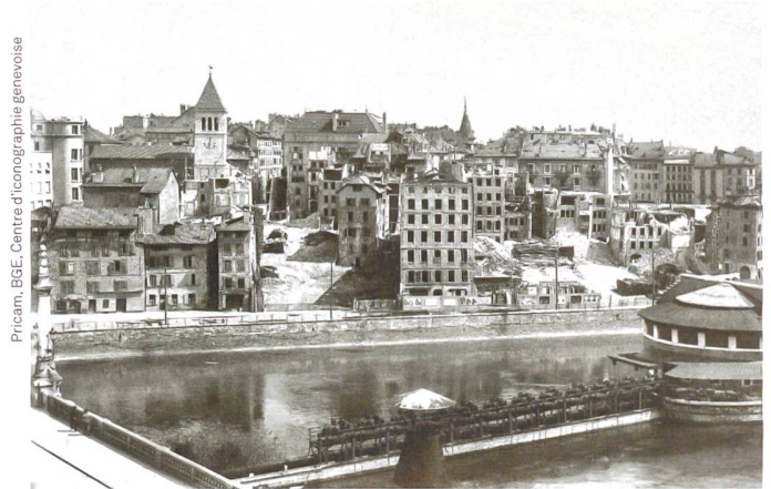
12. Juni 1931 – 12 juin 1931