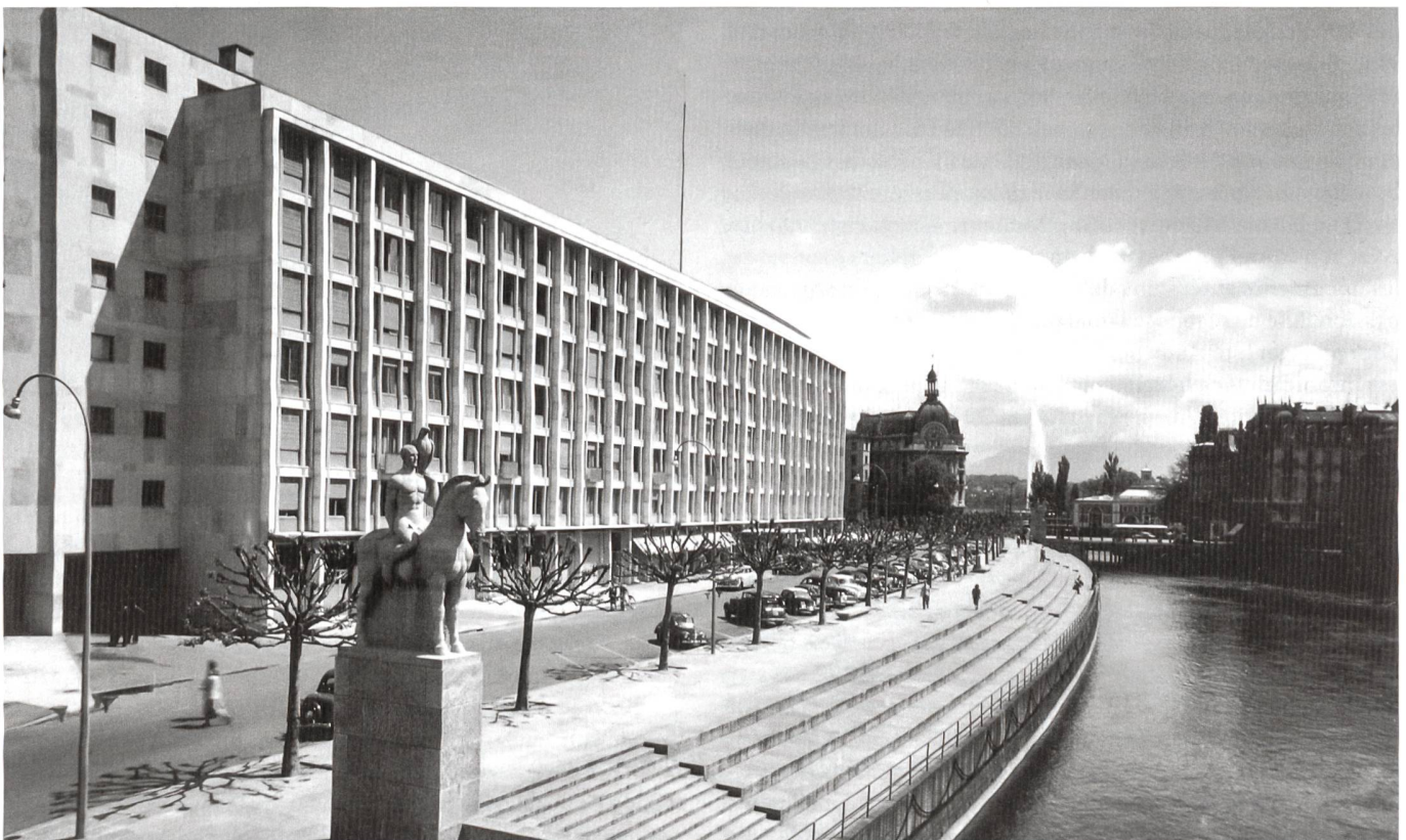
A. Mandanis, Archives d'architecture de l'Université de Genève, Fonds Saughey

Le succès ne se fait pas attendre. En ce début des années 1950, l'hôtel est le lieu où il faut se montrer et être vu. Pas une manifestation ne se déroule alors à Genève sans un apéritif, déjeuner ou