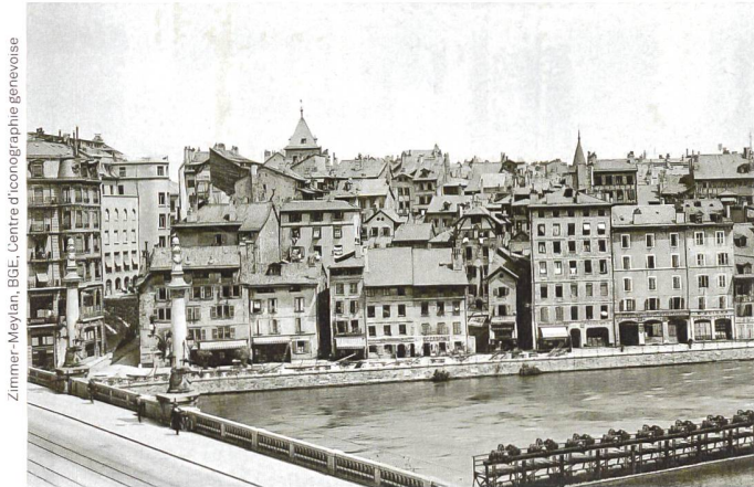
Nach 1896 – après 1896