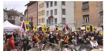
Bundnis Zukunft Schaffhausen