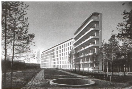
Alvar Aalto Museum