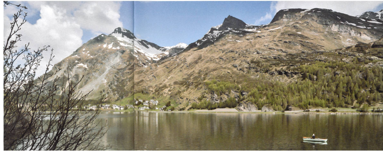
Der Druck auf das unüberbaute Land nimmt nur dann ab, wenn sich die Bevölkerung in verdichteten Siedlungen auch wohlfühlt (Silsensee im Obereingadin).

Es braucht hörbare Stimmen, die auf nationaler Ebene erklären, weshalb Verdichtung nicht nur als Auffüllen von Volumen verstanden werden darf, sondern als einmalige Chance, Dörfer und Städte positiv zu entwickeln und Fehler der Vergangenheit zu korrigieren. Besonders gefordert sind die Fachverbände, die verantwortungsvolle Architekten und Planerinnen in ihren Reihen haben. Sie und ihre Mitglieder müssen aktiv auf potenzielle Freunde aus anderen Lagern zugehen. Wer, wenn nicht engagierte Raumplaner, Städtebauer und Architekten könnten Bauern und Umweltschützer erklären, dass der Druck auf das unüberbaute Land nur dann abnimmt,