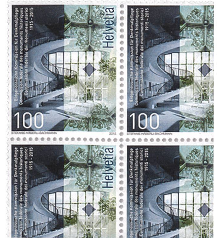
La Poste Suisse SA

Aujourd'hui comme autrefois, les monuments historiques et la diversité culturelle de l'environnement bâti sont sous pression. De grandes compétences spécialisées et des appréciations différenciées sont nécessaires pour pouvoir mettre en œuvre l'assainissement énergétique des bâtiments anciens et la densification vers l'intérieur, conformément aux exigences conservatoires. Car s'il est légitime de continuer à construire, il faut que cela se fasse dans le respect du bâti existant et de