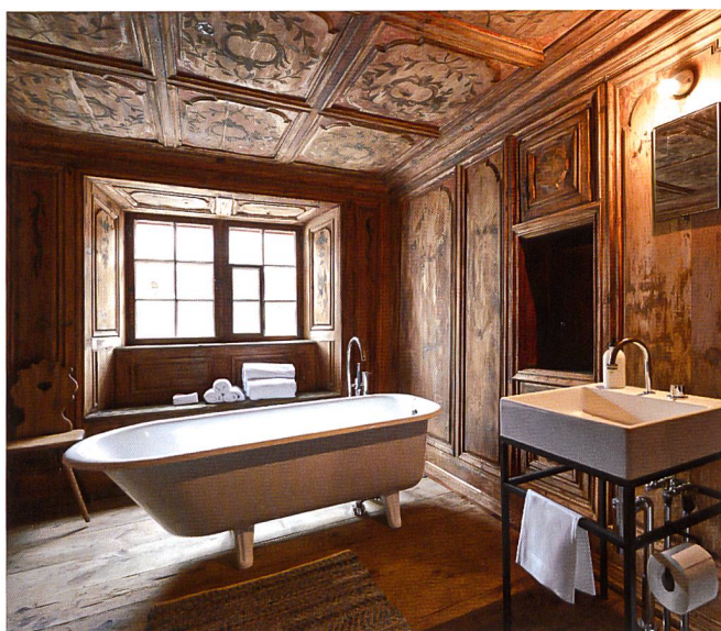
▲ TÜRЛИHUS, VALENDAS (GR)