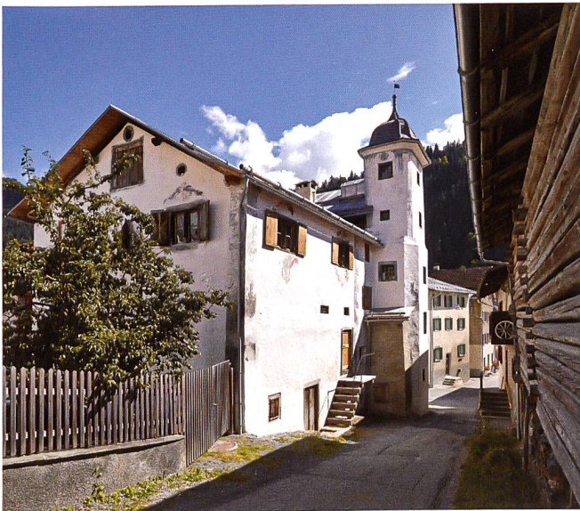
▼ STÜSSHOFSTATT, UNTERSCHÄCHEN (UR)