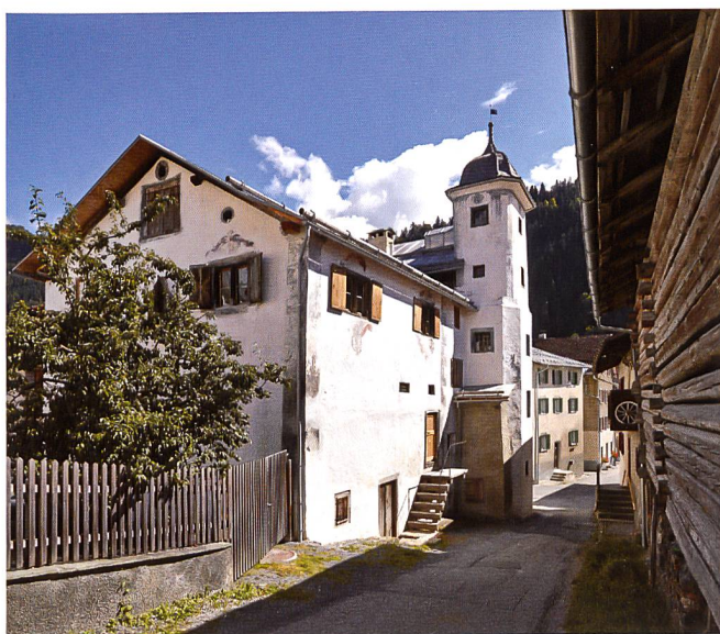
▼ STÜSSHOFSTATT, UNTERSCHÄCHEN (UR)