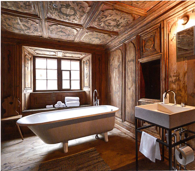
▲ TÜRЛИHUS, VALENDAS (GR)