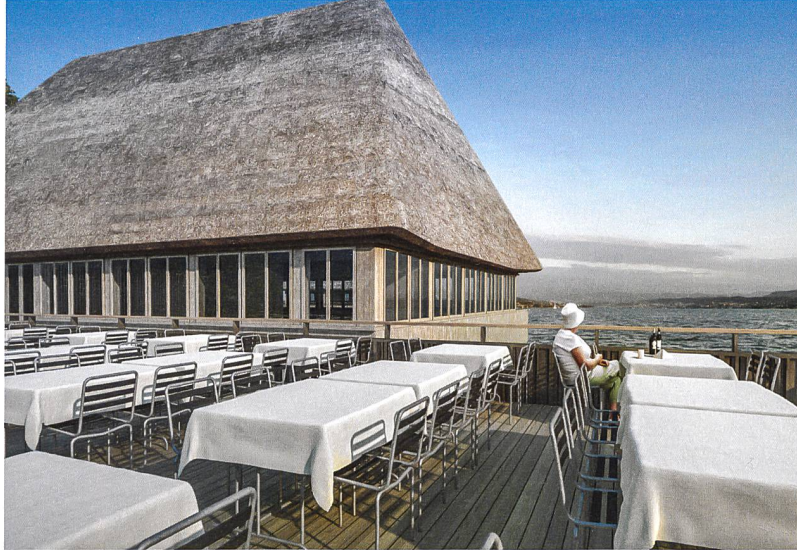
Visualisierung Architekturbüro Patrick Thurston

Le projet de concours pour la reconstruction du restaurant Fischerstube de Zurich au Zürichhorn ne prévoit aucune innovation architecturale et reprend le concept original de l'architecture Landi de 1939 (2010, Patrick Thurston).