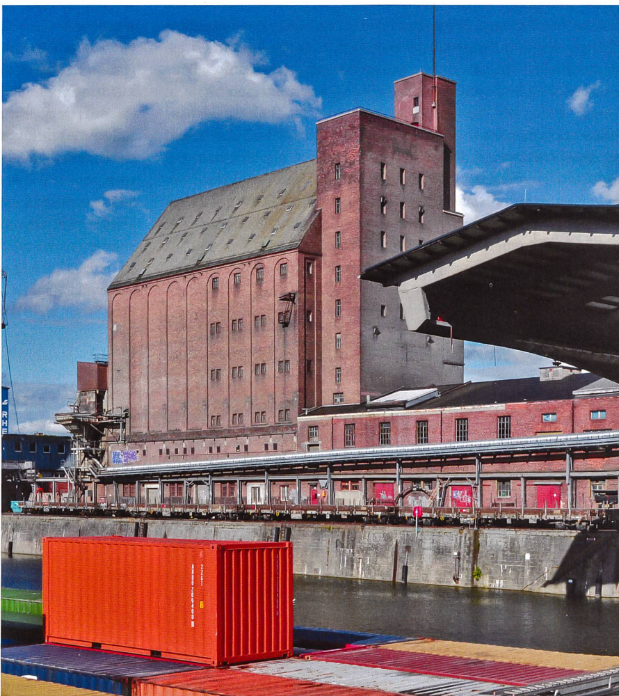
Kantonale Denkmalpflege Basel-Stadt

→ info@nike-kulturerbe.ch oder www.hereinspaziert.ch