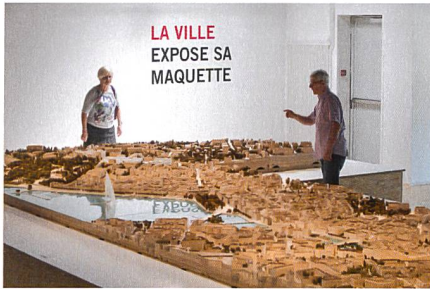
Didier Jordan/Ville de Genève

La Ville de Genève expose sa maquette et propose un regard croisé en trois phases sur cet outil. La première phase de l'exposition a présenté la maquette sous l'angle de l'aménagement du territoire et de l'urbanisme. La deuxième phase montre (du 16 septembre au 12 décembre 2015) les principales réalisations et certains projets de constructions et d'aménagements menés par la Ville de Genève. Quant à la troisième phase (du 20 janvier au 28 mai 2016), elle dévoile la maquette dans son entier (145 modules de 60 x 80 cm), ce qui correspond à un territoire réel de 16 km 2 . La maquette est le résultat de près de 30 années de travail minutieux pour reconstituer, quartier par quartier et à l'échelle (1:500), la ville de Genève en constante évolution. Des visites guidées seront organisées tout au long de l'exposition, sur réservation.