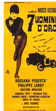
L'affiche de Sette uomini d'oro Filmplakat: Sette uomini d'oro

alors soulignés de profils dorés et les contrecœurs revêtus de marbres polis. L'attique est également altérée. Les façades du 5 e en léger retrait sont avancées au même nu que celles des étages courants et surmontées d'une corniche plate. Les ferronneries et les luminaires du rez-de-chaussée – de qualité mais dont le dessin Art déco révèle l'âge – sont enlevés. L'intérieur